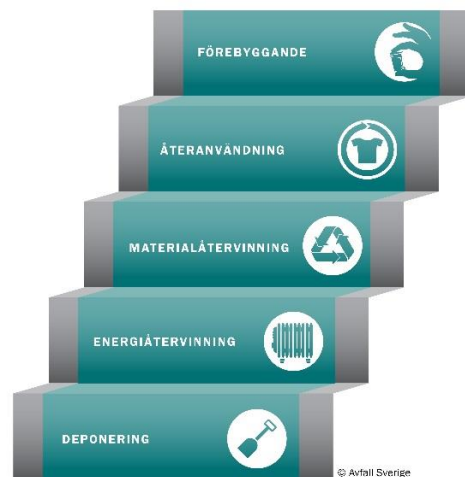
Figur 1. Avfallstrappan.

De översta trappstegen handlar om att förebygga uppkomsten av avfall och dess farlighet samt öka återanvändningen. Att förebygga avfall handlar om att tänka resurseffektivt och giftfritt tidigt. Det kan vara att designa en produkt för lång hållbarhet eller att planera inköp och användning för att minska onödigt spill. Det kan också handla om att stimulera människor och verksamheter att återanvända t.ex. möbler och kläder.