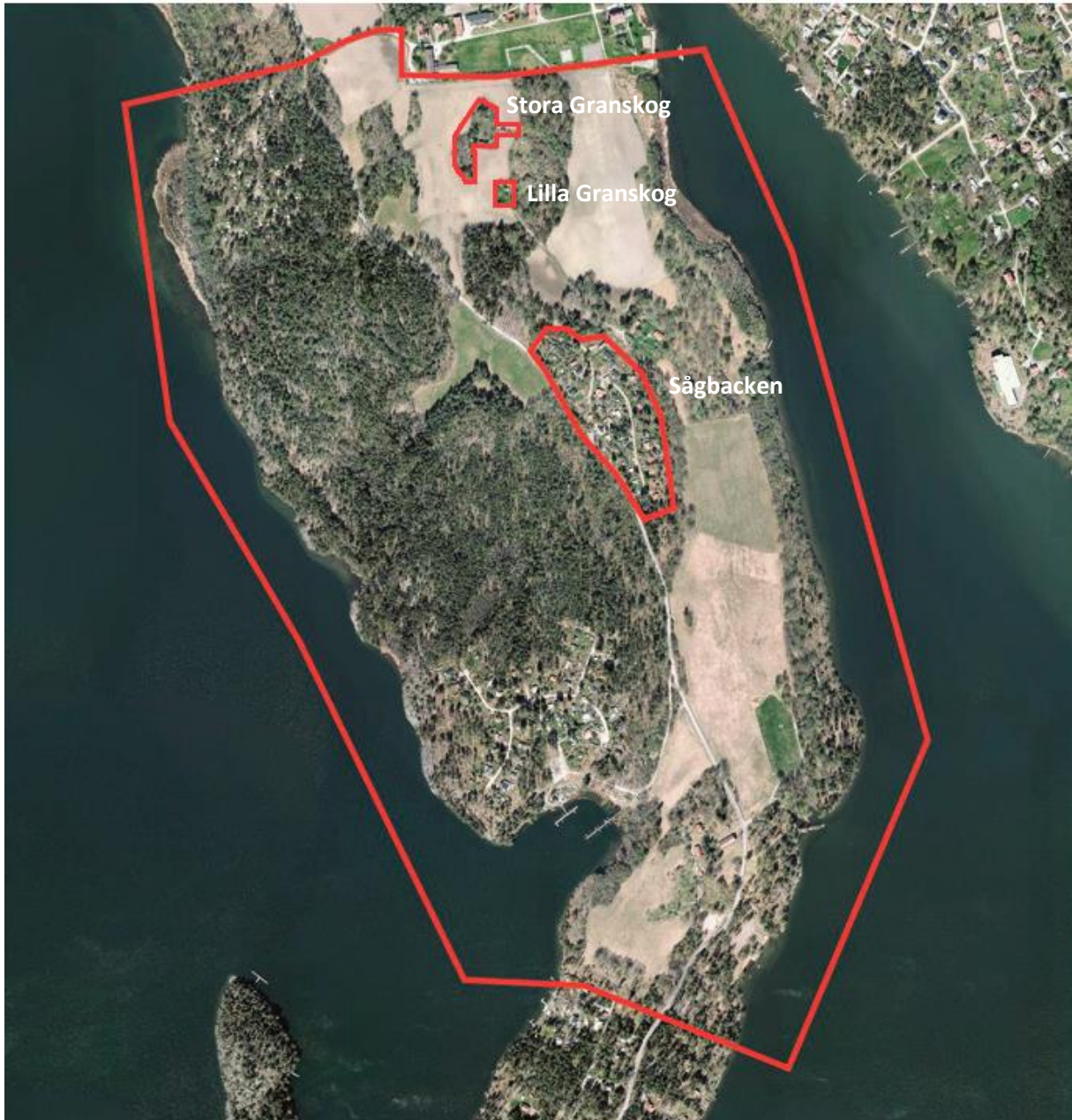
Flygfoto med planområdet markerat.