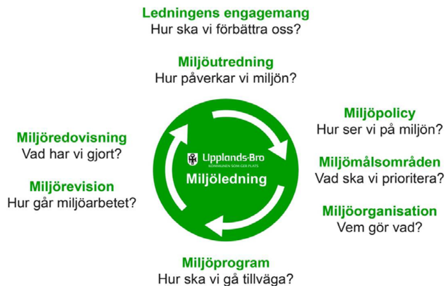
Figur 2: Beskrivning av Upplands-Bro kommuns miljöledningssystem

Upplands-Bros miljöledningsarbete kommer att bygga på den bild som du ser nedan”