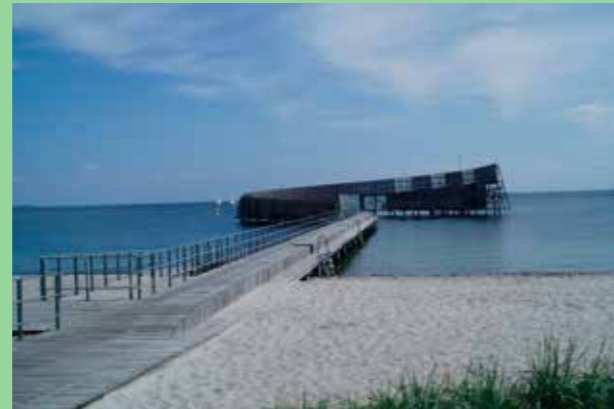
Kallbad Köpenhamn (Bild: C F Møller) Väl tillvaratagen närhet till vattnet.

utblickar över vattenlandskapen, i synnerhet i Kungsängen. Ta tillvara på detta. Fastigheter och allmän platsmark ska planeras med ett stort inslag av grönka. Möjligheter att skapa nya, öppna vattenytor ska tas tillvara.