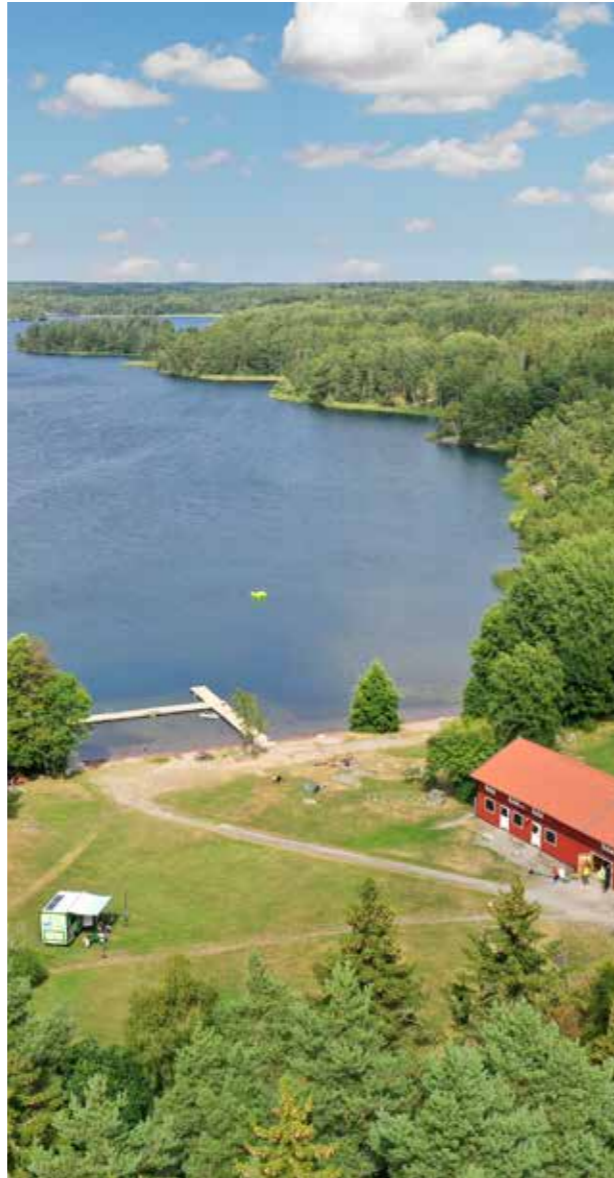
Hällkåna badplats

Gestaltningsskildningen är en tydlig beskrivning av arkitektur och gestaltning i förhållande till kommunens vilja och behov. Den blir en av flera utgångspunkter för det samtal medborgare emellan som rör utveckling av Upplands-Bro till en vacker och ännu bättre plats.