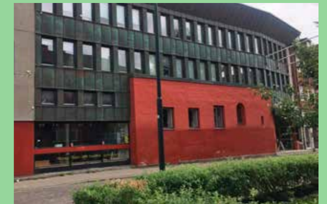
Lunds dans och musikgymnasium (Bild: C F Møller Arkitekt Hans Westman) Robusta material och karaktäristisk, omsorgsfull detaljering.