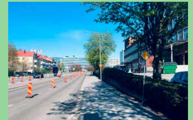
Tritonvägen Mariehäll, Stockholm. (Bild: CF Møller) Karaktärsstarkande grönska kombinerad med generösa mått för brukstrafik.