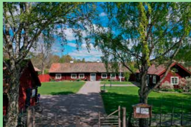
Staket, Kungsängen hembygdsgrd Förvaltande av byggnadstradition. Nytolkning och kontinuitet.