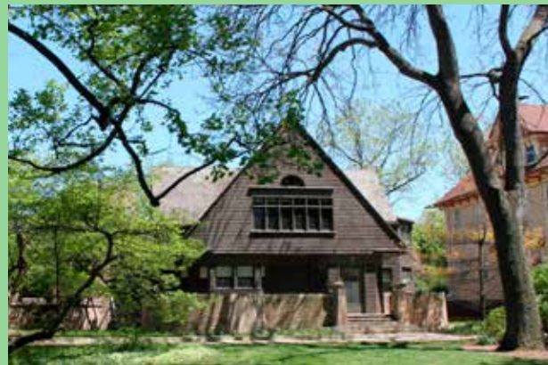
Oak Park, Chicago (Bild: C F Møller. Arkitekt Frank Lloyd Wright)