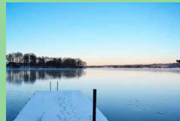
Dalgångslandskap. (Bild: Landsbygdsplan FÖP 2016 Upplands-Bro) Storlagna vyer och tillgängligt landskapsrum.