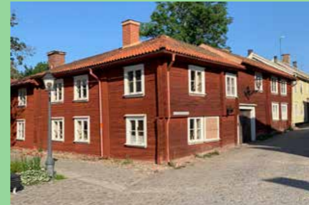
Eksjö Jönköping (Bild: C F Møller) Utemiljöer som bjuder in till olika användning.

Identifiera de skalor och måttförhållanden som finns på platsen. Ligger platsen centralt i tätorten eller i övergången mot natur och glesare bebyggelse?