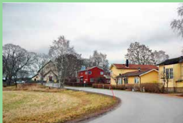
Bylandskap. Väglinjen, grönskans och byggnadernas placering ger en otvungen och enkel form.