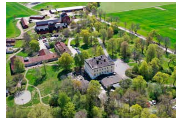
Villa Aske, Upplands-Bro Enkelt och karaktärsfullt.