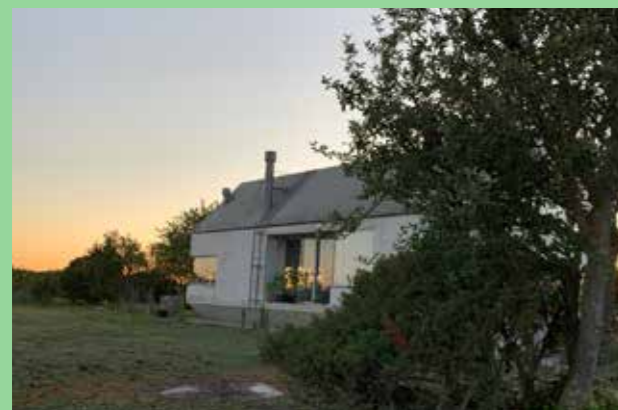
Ateljébostad Gottland (Bild: C F Möller. Arkitekt Anna Chavepayre) Traditionell form i ny tolkning