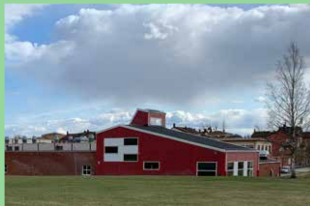
Brohuset (Bild: C F Møller)