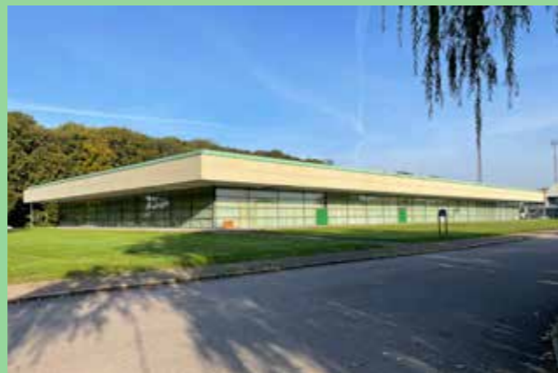
Landskrona idrottsplats (Bild: C F Møller, Arkitekt Arne Jacobsen)