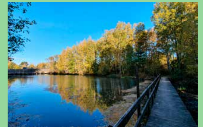
Tibbleviken Byggnadsverk som knyter samman land och vatten.