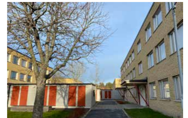
Bostadsområde Råby. (Bild: C F Möller) Kompletteringar som lägger nya lager till historien.