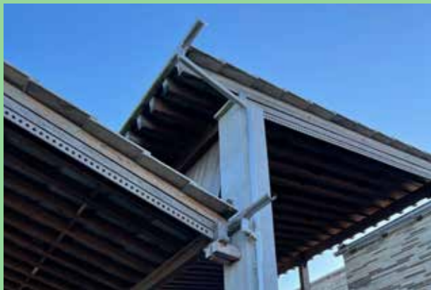
Sankt Knuts Kapell, Östra kyrkogården, Malmö (Bild: C F Möller, Arkitekt Sigurd Lewerentz)