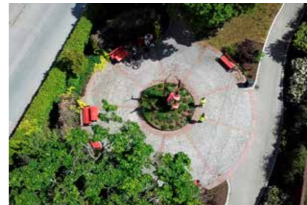
Järnvägsparken Bro Grönska och material av hög kvalitet.