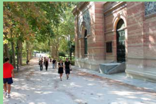
Madrid Enkel och vacker hantering av volym och färg.