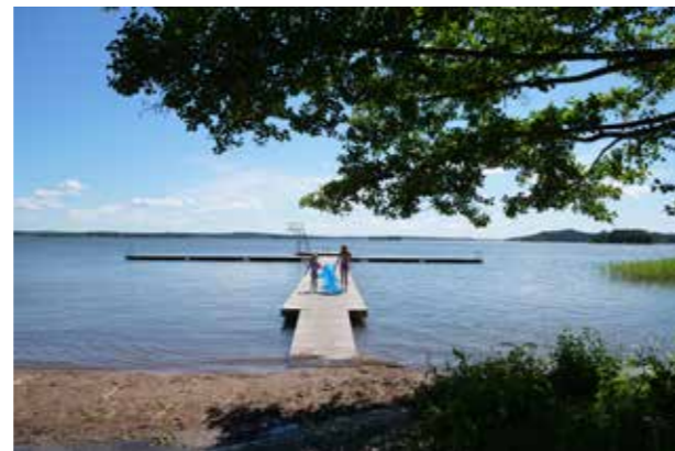
Björknäs camping och bad Storslaget, tillgängligt landskapsrum.