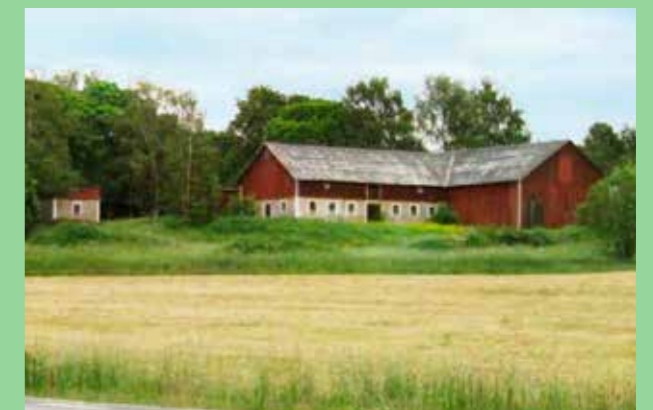
Bebyggelse i skogsbryn. (Bild: Landsbygdsplan FÖP 2016 Upplands-Bro) Placering på moränkant. God grundläggning och respekt för odlingsmarken ger byggnaderna en bra skala i landskapet.