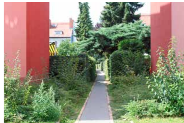
Berlin. (Bild: C F Møller) Bebyggelse sammanvävd med naturen.