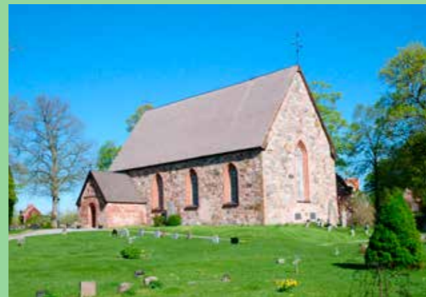
Hätuna kyrka