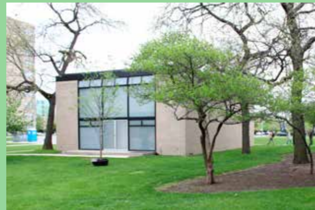
Illinois Institute of Technology, Chicago (Bild: C F Møller, Arkitekt Mies van der Rohe) Enkel volym med tydlig proportionering.