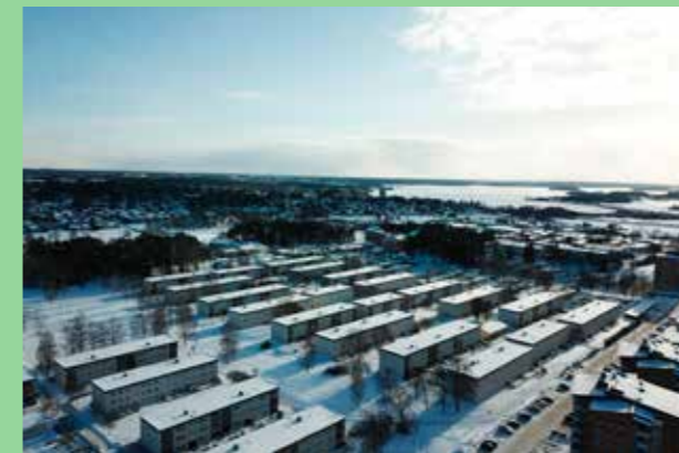
Kungsängen Tibbleområdet