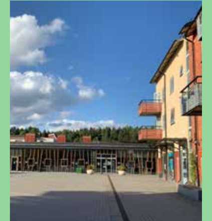
Brohuset (Bild: C F Møller)