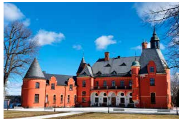
Lejondals Slott. Karaktärsfull kontrast till omgivande naturlandskap.