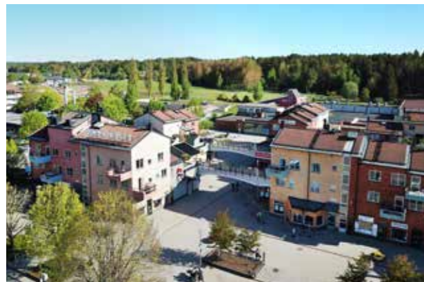
Bro centrum Variation i kulör och skala.

Gestaltningens policy kan också användas som underlag för att ge stöd vid markanvisningar och ge vägledning om gestaltning i ärenden som inte uppenbart är myndighetsfrågor men där det finns ett intresse att diskutera konsekvenserna av det som byggs.