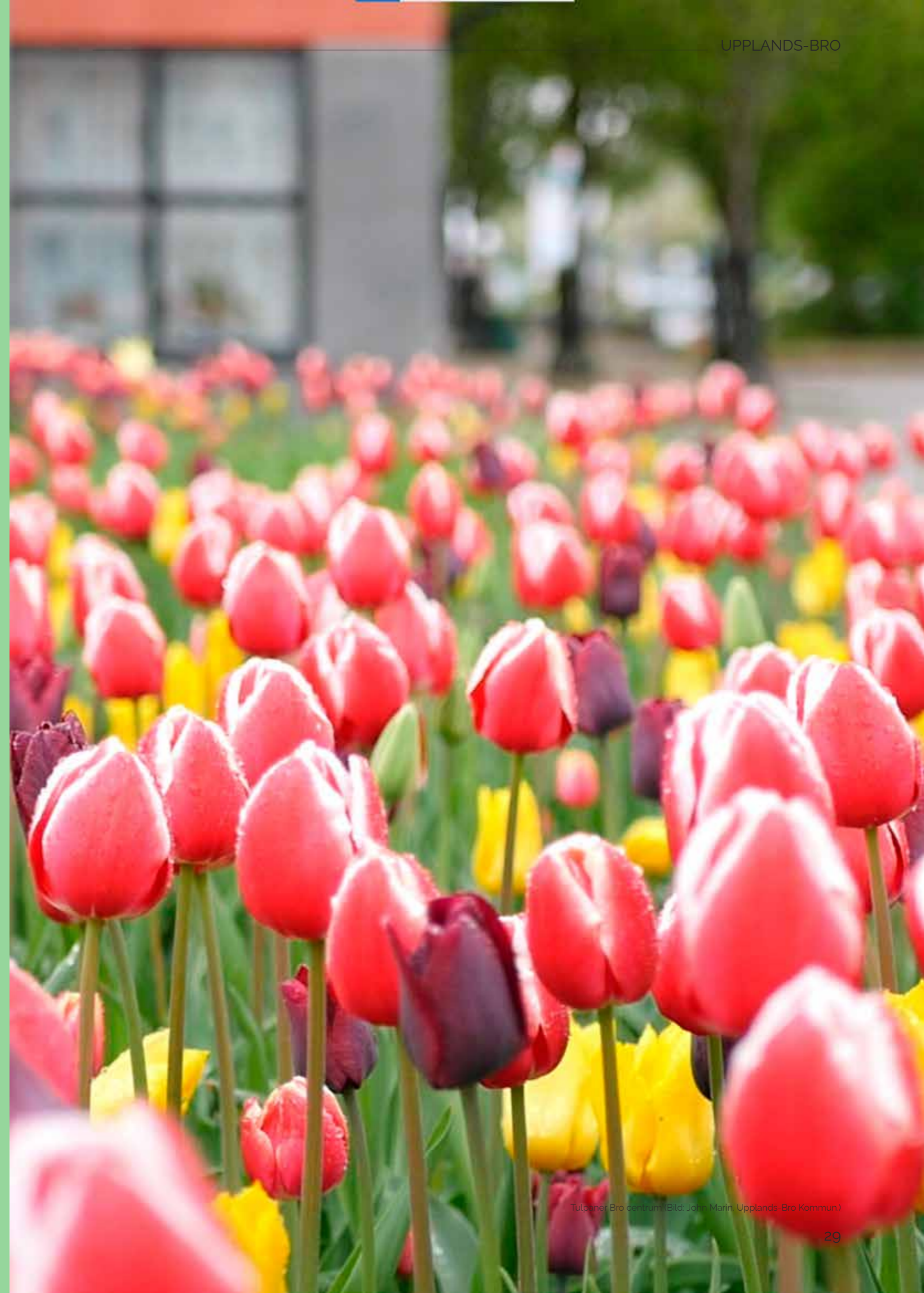
Tulpaner Bro centrum