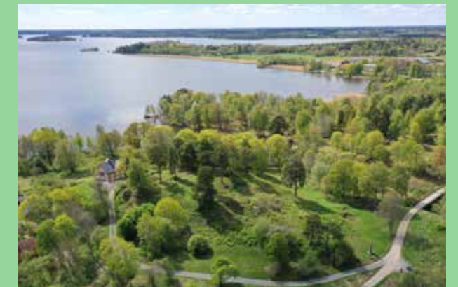
Biskoparnas borg, Upplands-Bro Riktigt med grönska och vattennära områden.