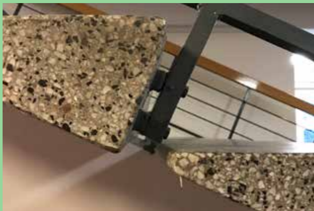
Sporshall Kiruna.