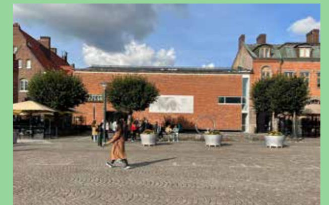
Lunds konsthall 1957 (Arkitekt Klas Anshelm) Enhetlighet i material. Stillsam, varierad färgskala.