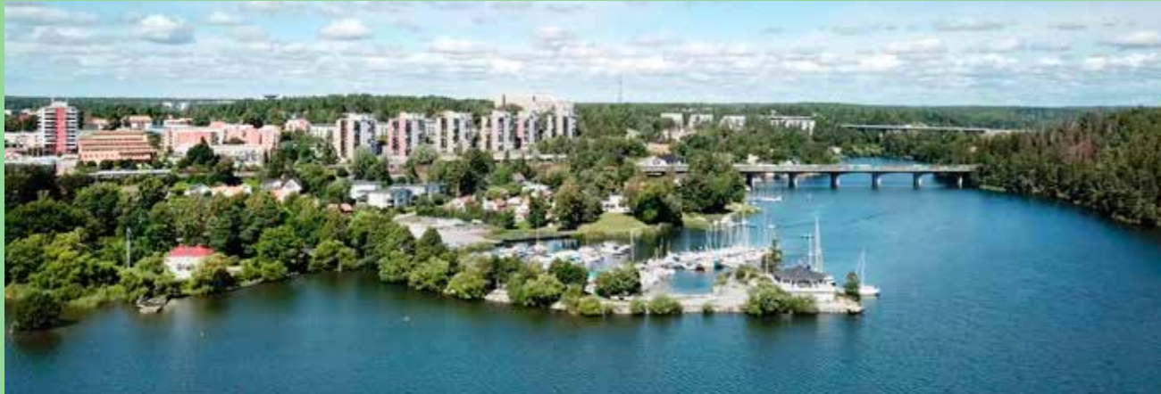
Upplands-Bro Naturen och Mälaren är närvarande i hela kommunen.