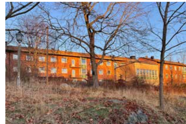
Brunnsviken (Bild: C F Möller) Naturnära färger och omsorgsfull detaljering.