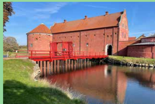
Landskrona slott, Skåne (Bild: C F Møller.) Försiktigt tillägg i kulturhistorisk miljö.