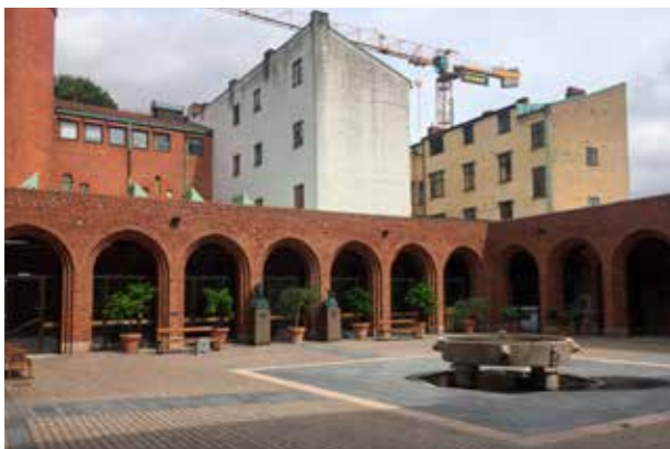
Lund (Bild: C F Møller)