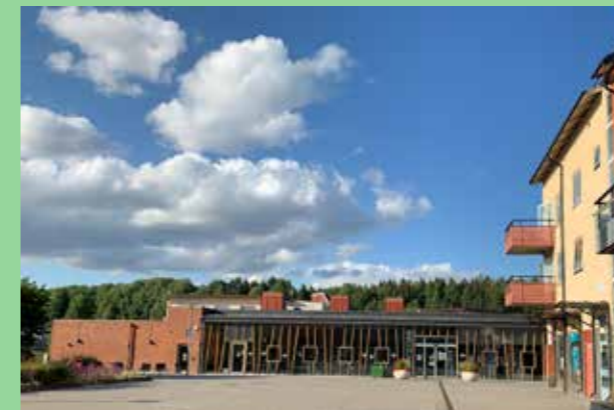
Brohuset (Bild: C F Møller) Fasader på offentlig byggnad som både är vägg i det offentliga rummet, karaktärsskapande objekt och inbjudande övergång mellan ute och inne.