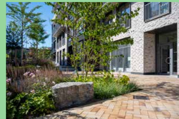
Futura, Södra Brunnsög, Lund (Bild: C F Møller, Arkitekt C F Møller)