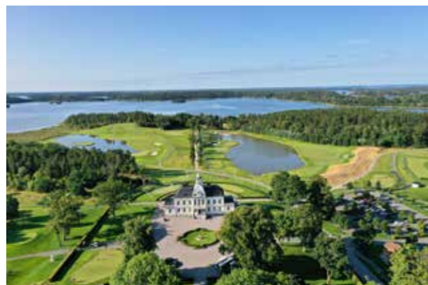
Brogård, 1888. (Bild: John Marin, Upplands-Bro kommun) Karakär och värdighet.