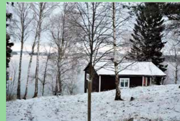
Fritidslandskap. Vegetation, byggnad och vatten skapar fint djup.

Detaljer och utformning i den lilla skalan är inte av prioriterad betydels på landsbygden. Omsorg är alltid viktigt.