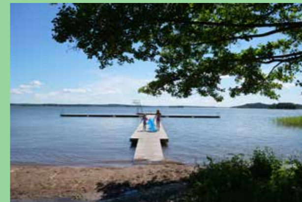
Björknäs camping Allmänt tillgängligt vatten, en stor kvalitet.