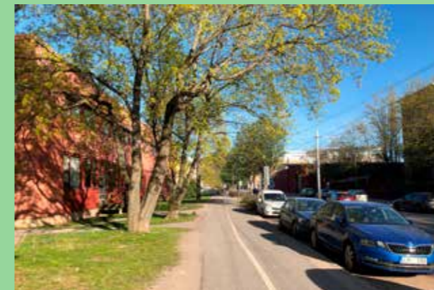
Lövholmens industriområde. Väl valda material i karaktärsstark byggnad. Kontors-, verkstads- och industribebyggelse kompletterar varandra och skapar en rik och varierad miljö.

fasader förhåller sig till det omgivande landskapet och trafikmiljöer. Gestalta byggnader på ett sätt som är gripbart på olika avstånd.