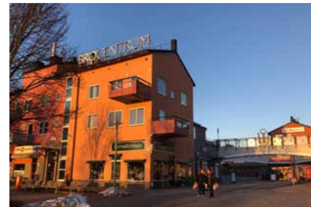
Bro torg (Bild: C F Möller) Variation i kulör och skala.