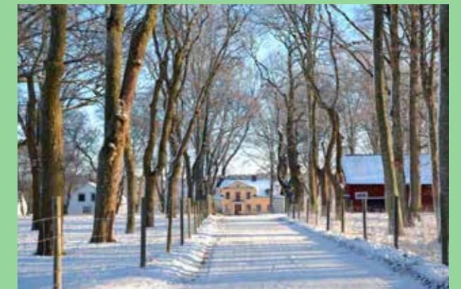
Herrgårdslandskap. (Bild: Landsbygdsplan FÖP 2016 Upplands-Bro) Grönska och byggnader samverkar för att skapa vyer och scenerier.