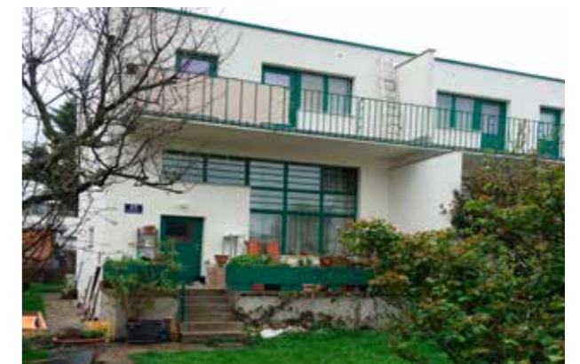
Werkbundsiedlung, Wien, Österrike. 1930. Arkitekt Adolf Loos) Välproportionerad förgårdsmark. Enkla, omsorgsfulla byggnader.