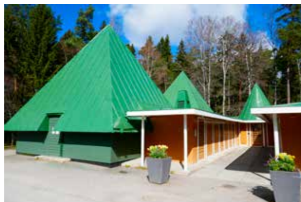
Skogskyrkogården f.d. ekonomibyggnad (Arkitekt Gunnar Asplund) Karakärstarka former med naturnära kulörer och material.