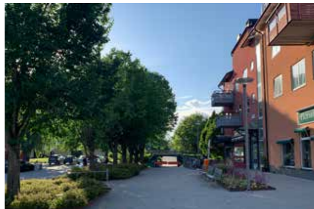
Bro (Bild: C F Möller)

och vad vi inte gillar. Med ansvaret att forma platser och byggnader kommer ansvaret att formulera oss kring vad vi tycker. Ibland kan vi överraska oss själva med att då se kvaliteten i det vi inte gillade. Var särskilt varsam med det som är 30-40 år gammalt. Det är en känslig period för en byggnad då den inte längre känns ny och fräsch. Inte heller har den tagits upp i historien av arkitekturhistoriker eller i en allmänt spridd retrokärlek till de egna kvarteren. Var varsam och modig.