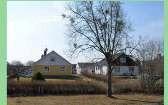
Enköpingsvägen Enhetlighet i form, variation i färg och material.