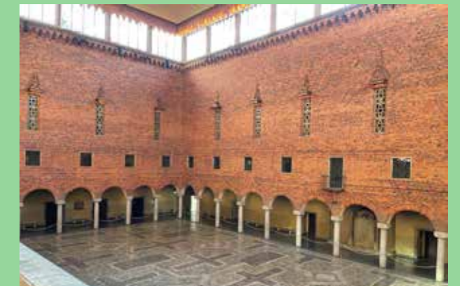
Stockholm stadshus (Bild: C F Møller. Arkitekt Ragnar Östberg) Interiört torg.