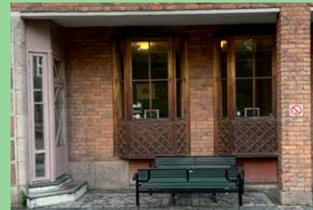
Socialstyrelsen, Västerbroplan (Bild: C F Møller. Arkitekt Kjell Ödeen) Lekfull och värdig detaljering.