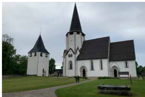
Kyrka, Gotland (Bild: C F Möller) Landmärke.