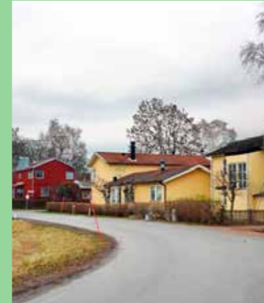
Bylandskap (Bild: Landskapsplan FÖP 2016)