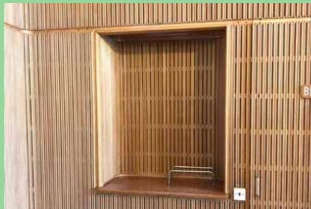
Aarhus rådhus (Bild: C F Möller, Arkitekt Arne Jacobsen)