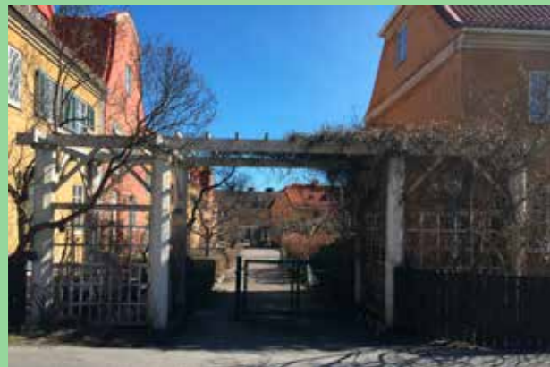
Bromma, Stockholm (Bild: C F Møller) Varma material och närhet till grönka.