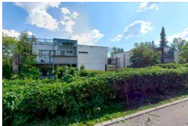
Esbo, Finland 1982. (Bild: C F Møller, Arkitekt Erkki Kairamo) Lummigt område med byggnader som kombinerar ett begränsat antal element på många olika sätt.