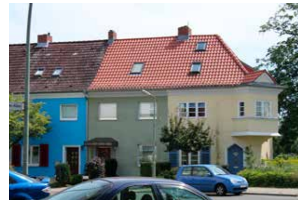
Berlin (Bild: C F Möller) Enkla byggnadsformer får karaktär genom variation i kulör.

De som handlägger och bereder ärenden i plan- och byggprocessen ska använda Gestaltningsskildningen som stöd för att upprätta checklistor och stöddokument för det specifika projektet utifrån dess karaktär. Den bidrar också med exempel och råd som kan utgöra ett stöd i samtal och rådgivning till allmänhet och andra som är intresserade av att bygga i kommunen.