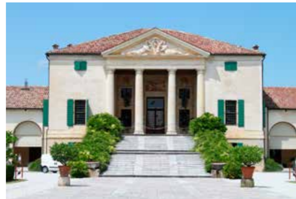
Villa Emo, Italien (Bild: C F Møller, Arkitekt Andrea Palladio) Enkel byggnadsvolym med stark materialverkan.