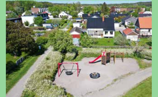
Mälarparken, Upplands-Bro Enkelt och öppet.

Skapa en palett av karakteristiska detaljer utifrån projektets förutsättningar. Formulera hur de bidrar till att tillföra kvalitet till platsen.