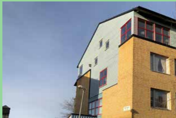
Bro. Intensiva färger som skapar kontrast.