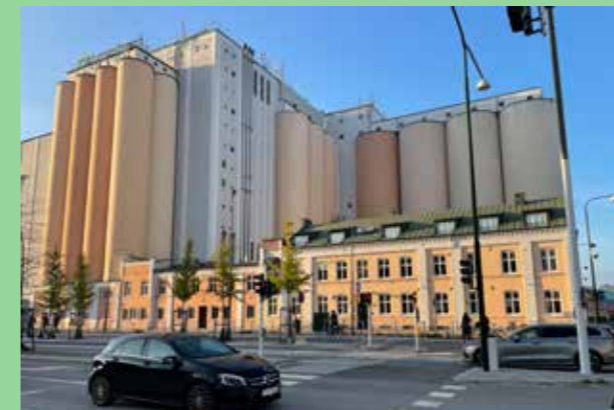
Malmö hamnområde (Bild: C F Møller)

Detta är viktiga aspekter för att byggnader i dessa områden ska bidra till kommunens skönhet och upplevas som vackra. Ofta har dessa byggnader innehåll som gör att det inte går att kompromissa särskilt mycket med storleken. Formulera tydligt hur volym och