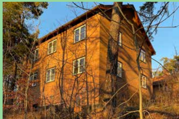
Hus i sluttning, Norra Djurgården (Bild: CF Møller) Platsens utmaningar skapar kvalitet och skönhet.