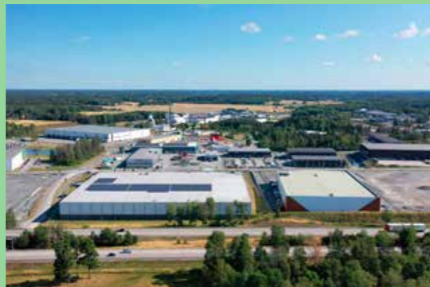
Brunna industriområde, Upplands-Bro. Grönska och miljöer för gående i landskap präglad av trafik.