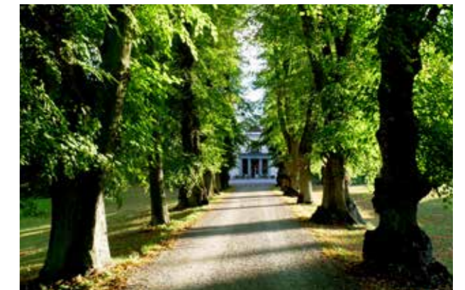
Almare stäket, Upplands-Bro Grönska som förenar mjukhet och stramhet.