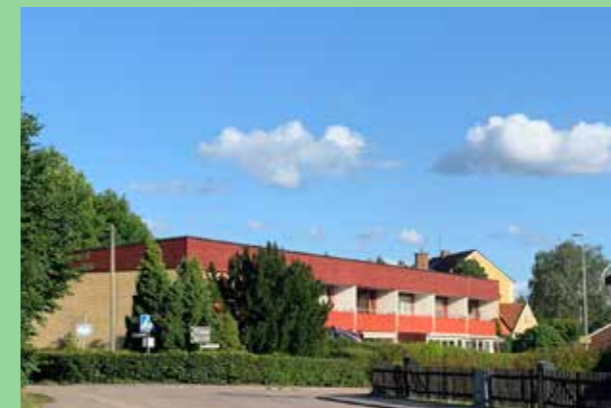
Bro (Bild: C F Møller.) Hållbara naturmaterial med fin materialverkan.