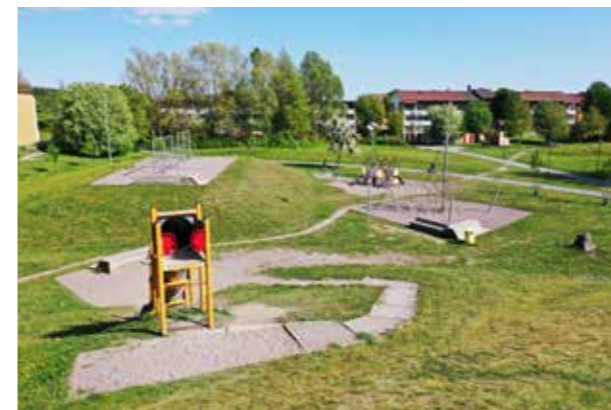
Råbyparken. Generöst, grönt rum med utrymme för liv och verksamhet.