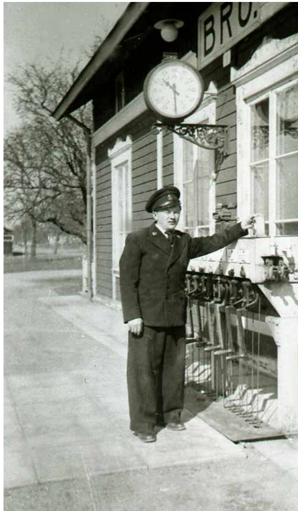
Bro stationsområde.

Kommunen har funnit att detta är en god tid att reflektera över vad man vill med framtidens fysiska miljö. Hur vill vi att det framtida Upplands-Bro ska se ut? Ett vackert Upplands-Bro med den diversitet mellan tätortsmiljöer och landsbygd som skapar kommunens speciella karaktär. Vad är detta mer konkret? Som verktyg för att åstadkomma detta har man beslutat att ta fram denna Gestaltningpolicy.