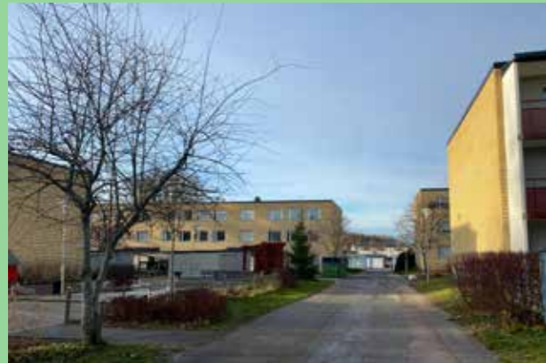
Råby, Upplands-Bro (Bild: C F Møller)

Ser man Mälaren eller någon av sjöarna? Att ta tillvara närheten till vattnet är viktigt. Landskapsformer och topografi gör att man på många platser har möjlighet till storslagna