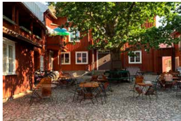
Eksjö. (Bild: C F Möller) Storslaget offentligt rum med småskalig bebyggelse.

En plats kvaliteter utgörs av egenskaper i befintlig bebyggelse, landskapsrum och natur-element som träd, berghällar och vatten. En omsorgsfull gestaltning som på ett genomtänkt sätt tolkar och understryker områdets kultur- och naturvärden bidrar till att stärka områdets identitet.