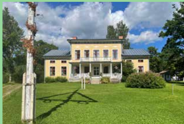
Bjuråker, Hälsningland (Bild: C F Möller)

berg tas inte jordbruksmark i anspråk och bebyggelsen ansluter till det sätt byggnader har placerats genom historien.