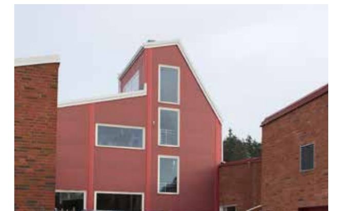
Bro. Varierat taklandskap.