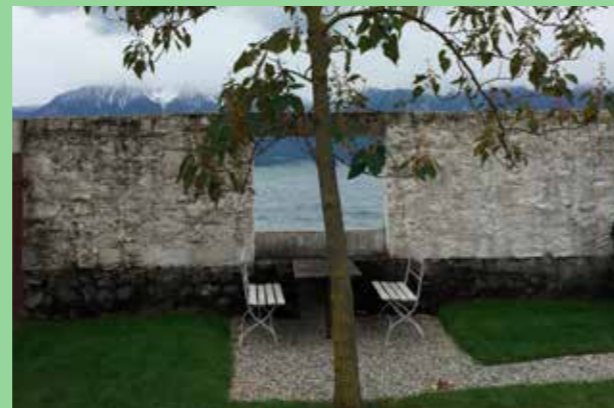
Mur / staket Uppfinningsrikedom och finurlighet.