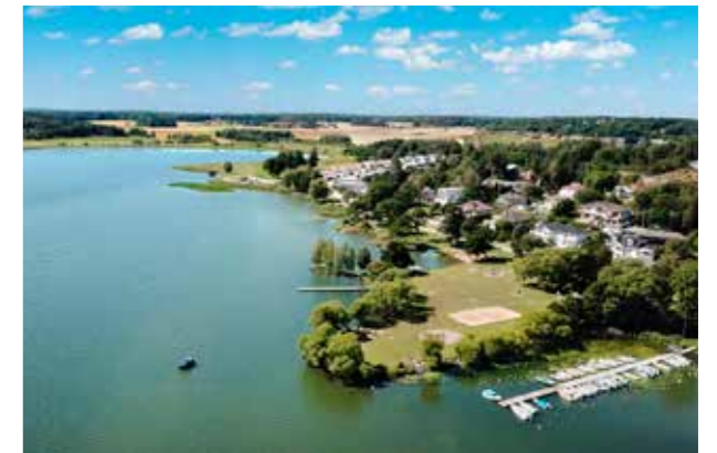
Gröna uddens badplats