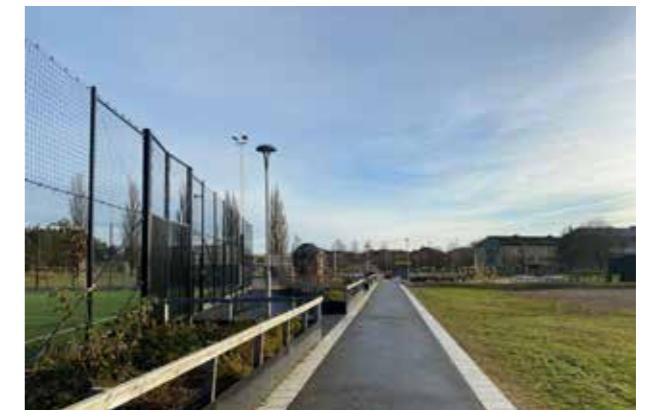
Råby fotbollsplan (Bild: C F Möller) Enkelhet och närhet till naturen.