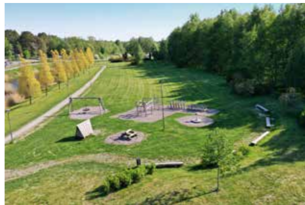
Svampsparken Närhet till naturen.