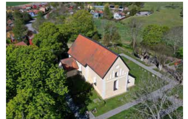
Håbo-Tibble kyrka Enkel byggnadsvolym med stark materialverkan.

Den som vill bygga i Upplands-Bro ska med Gestaltningsskildningen i hand enkelt kunna skapa sig en bild av vad det krävs för nivå på gestaltning för det projekt man tänkt sig. Gestaltningsskildningen förmedlar bilden av vad Upplands-Bro är och hur det ska förvaltas och utvecklas.