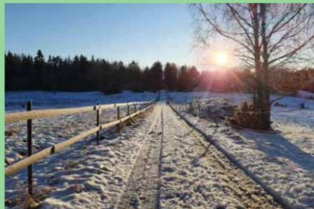
Hällkana, Upplands-Bro Kulturlandskap som en del av bebyggelsehistorien.