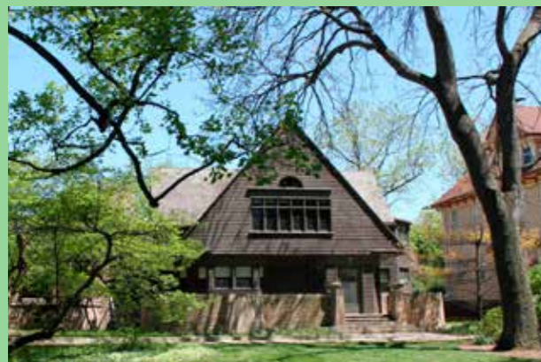
Oak Park, Chicago (, Arkitekt Frank Lloyd Wright)

Upplands-Bro har med sitt läge vid Mälaren och sin stora andel natur och odlingslandskap unika förutsättningar. Att ta dessa tillvara är en avgörande utgångspunkt för att skapa vackra miljöer av hög arkitektonisk kvalitet.