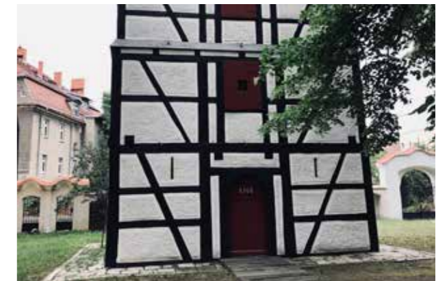
Świdnica. Klockstapel, 1600-tal (Bild: C F Möller) Omsorgsfullt omhändertagen konstruktion och detaljering.