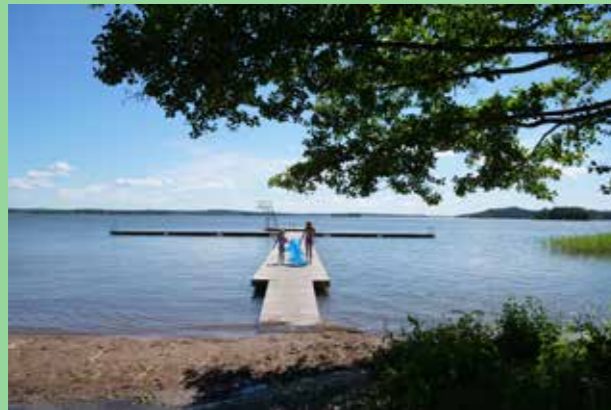
Björknäs camping

Upplands-Bro präglas av sin långa historia och de avtryck människor gjort. Ny bebyggelse ska lägga nya karakteristiska lager på detta. Inspireras och förhålla sig utan att bli blek och undfallande. Nybyggnation och utveckling av nya områden ska vara lyhörd mot platsens speciella karaktär och bidra till att skapa en vacker kommun.