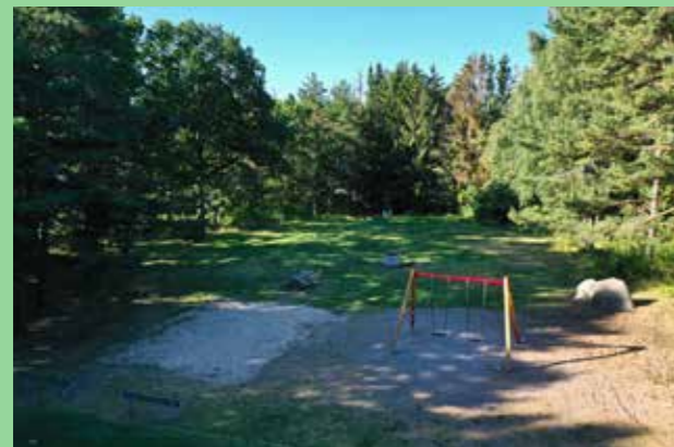
Storstorps lekplats, Upplands-Bro

Ny bebyggelse placeras och utformas med hänsyn till landskapsformer, skogsbryn och vägar. Genom att utnyttja moränkanter och