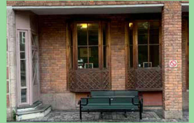
Socialstyrelsen, Västerbroplan (Bild: C F Möller, Arkitekt Kjell Ödeen)

Material och kulörer präglar vår uppfattning om en byggnad. Det är viktigt att förstå och förhålla sig medvetet till hur färg och material verkar i det specifika sammanhanget. De delar av en byggnad som är närmast där vi rör oss ska utföras med material som är behagliga att beröra och betrakta. Material ska också upplevas vackra på avstånd.