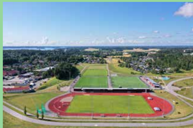
Kungsängens idrottsplats. Väl placerad, ytkrävande verksamhet.