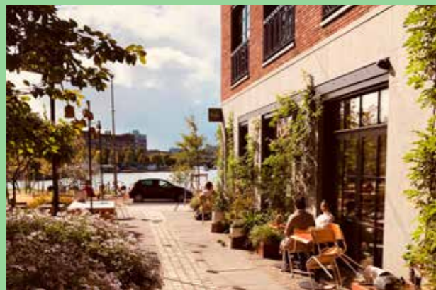
Little C, Rotterdam (Bild: C F Møller, Arkitekt: Juurink [H] Geluk) Småskaliga miljöer vid förhållandevis storskaliga byggnader.