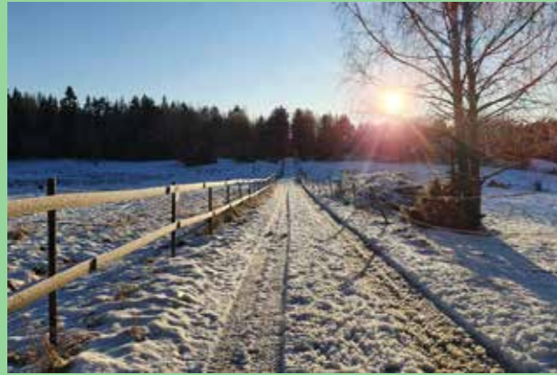
Hällkåna Friluftsområde