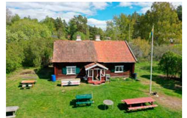
Sandhagsstugan Enkel och otvungen komposition.