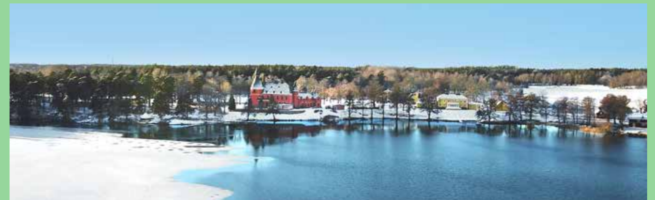
Lejonslotts slott