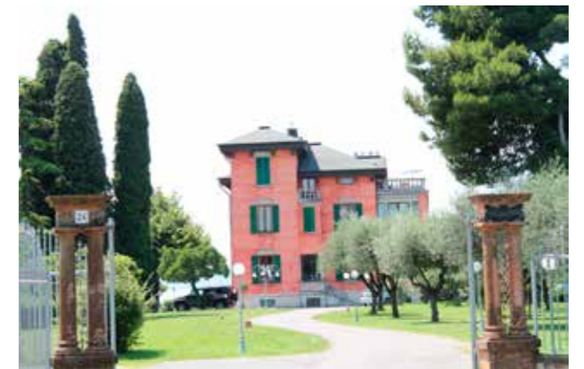
Italien Enkel och omsorgsfull detaljering i samspel med ljus och grönska.