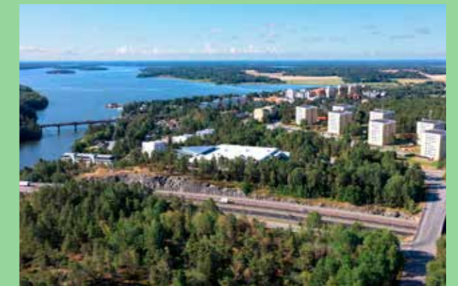
Kungsängen Distinkt utformning i samspel med platsens förutsättningar.

Byggnader i verksamhetsområden bör utformas med omsorg om detaljer vid entréer och platser där man rör sig till fots. Detaljeringen kan vara enklare än i tätorter men ska vara medvetet utförd.