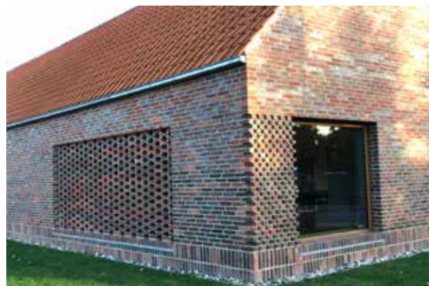
Församlingshem (Bild: C F Möller) Enhetlighet i material, omsorgsfull detaljering.