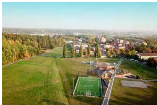
Stjärnparken, Bro Användbara, gemensamma platser för aktiviteter.