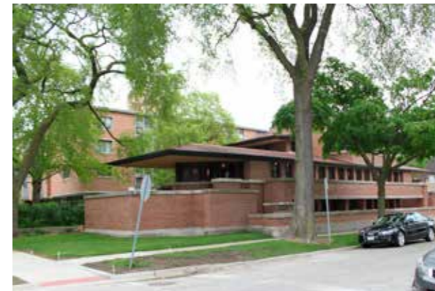
Robie House, Chicago, 1909 (Bild: C F Möller. Arkitekt Frank Lloyd Wright) Omsorgsfull detaljering.