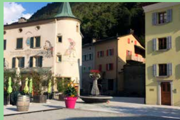
Torg, Martigny Schweiz (Bild: C F Møller.) Intimt möte mellan olika skalor.