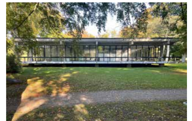
Landskrona konsthall (Bild: C F Möller. Arkitekt Sten Samuelson och Fritz Jaenecke) Karaktärsfullt samspel mellan byggnad och natur.