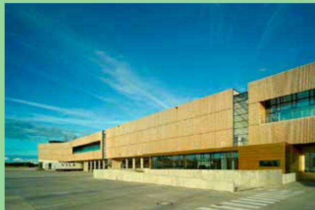
Logistikcenter, Haderslev Danmark (Bild: Adam Mörk, CF Møller) Väl valda material i karaktärsstark byggnad.

Lägg vikt vid det som inte är det storskaliga trafiklandskapet. Finns det möjlighet att röra sig här till fots? Hur förhåller sig platsen till omgivande områden? Ta vara på de möjligheter som finns att knyta platser till varandra. Differentiera. De stora trafikflödena behöver sin yta. Skapa skyddade intimare miljöer där man kan röra sig till fots. Skapa gatusektioner som rymmer alla nödvändiga funktioner.