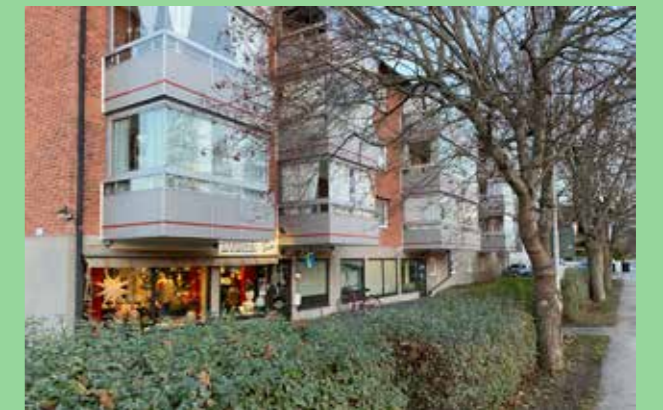
Bro, Upplands-Bro (Bild: C F Møller)