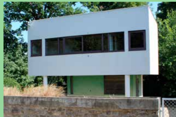
Komplementbyggnad (Bild: CF Møller) Enkel, stilig och festlig formgivning.