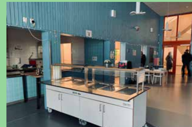
Herrestaskolan Järfälla (Bild: C F Møller)