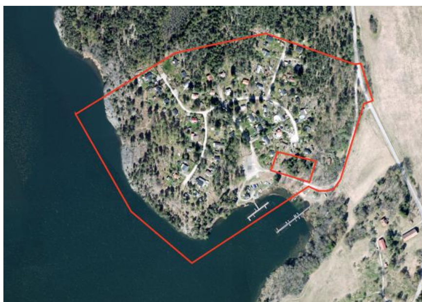
Bild som visar gällande detaljplan, planområdet markerad med rött.

Detaljplan nr Ä6302 som antogs 2023. I detaljplanen är planområdet utpekade som bostadsområde. Planens genomförandetid för de bestämmelser som har ändrats går ut 7 november 2028. För resterande bestämmelser har genomförandetiden gått ut.