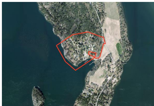
Bild över planområdet (till höger) samt dess lokalisering i Upplands-Bro kommun (till vänster). Planområdet markerat i rött.

Planområdet är cirka 15 hektar stort och ligger i Bro på Ådöhalvön. Området avgränsas i öster av Ådövägen och Verkaviksvägen, i söder och väster av Mälaren och i norr av skogsmark.