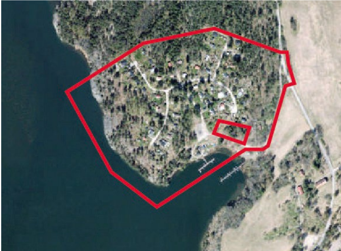
Flygfoto med planområdet markerat med röd linje.

Planområdet är cirka 15 hektar stort och ligger i Bro på Ådöhalvön. Området avgränsas i öster av Ådövägen och Verkaviksvägen, i söder och väster av Mälaren och i norr av skogsmark.