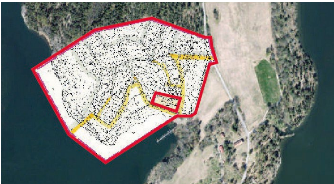
Gällande plan för området. Ett mindre område undavtogs vid fastställandet, där gäller byggnadsplan 5601.

Förslaget till ändring gäller bara de bestämmelser som beskrivs i ett särskilt dokument, Planbestämmelser. Dessa bestämmelser ska läsas tillsammans med gällande plan 6302-F. De bestämmelser som ändrades i 8105 finns upptagna i det nya dokumentet med bestämmelser, dessa ersätts därmed. För att förslaget ska vara tydligt nog har alla planbestämmelser samlats i ett dokument, som ersätter de tidigare dokumenten med planbestämmelser.