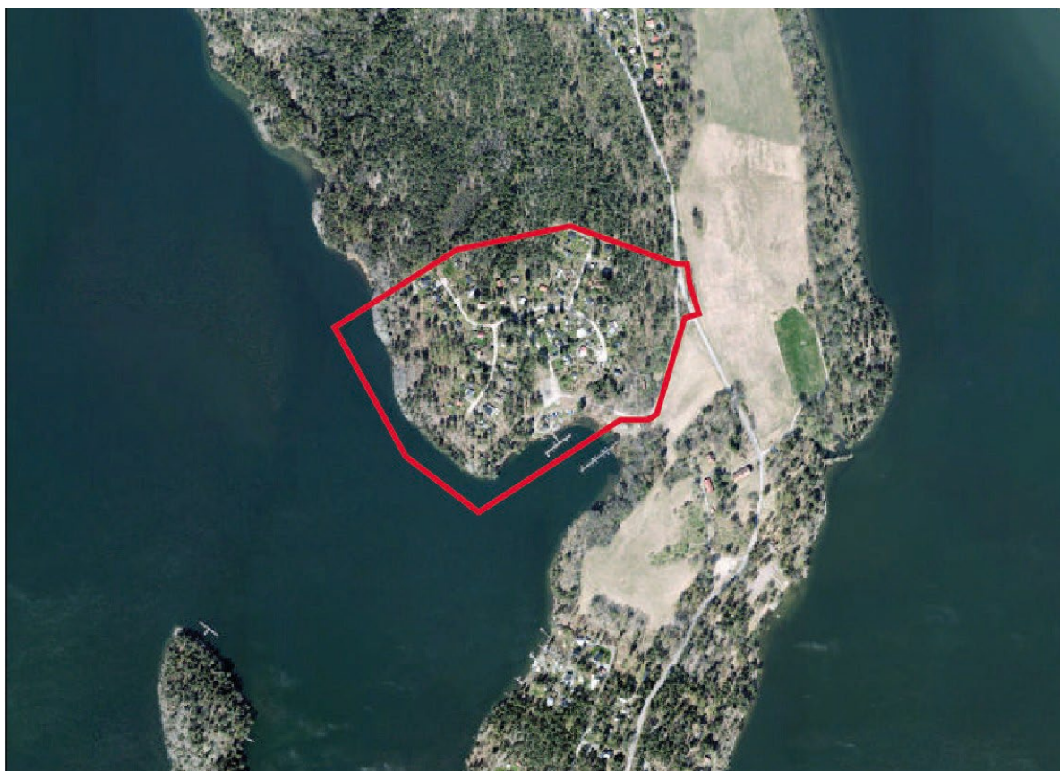
Översiktskarta med planområdet markerat.