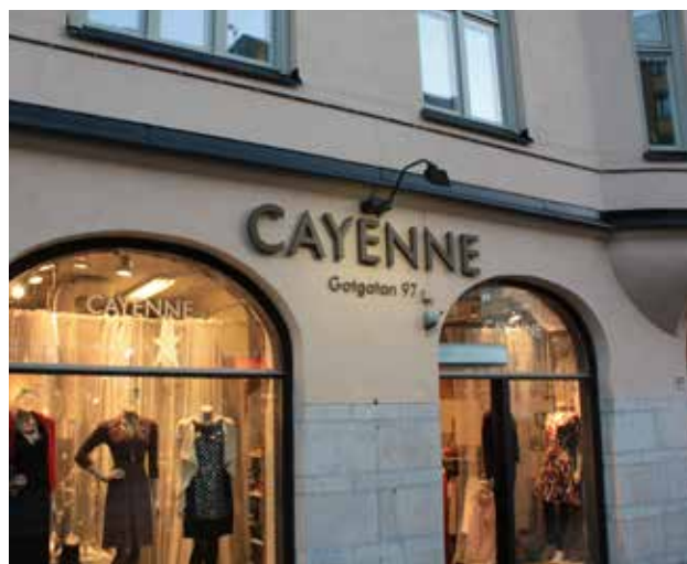
Exempel på skyltning och belysning där stor hänsyn har tagits till byggnadens storlek, kulör och karaktäristiska form.

Skyltars ljud och ljus ska inte störa boende och trafikanter. Skyltar får inte utformas så att de kan förväxlas med trafiksignaler, vägmärken eller ljussignaler från uttryckningsfordon.