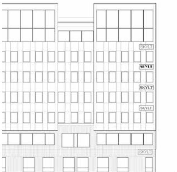
Illustration över placering av skyltar som tar hänsyn till byggnadens form och storlek.