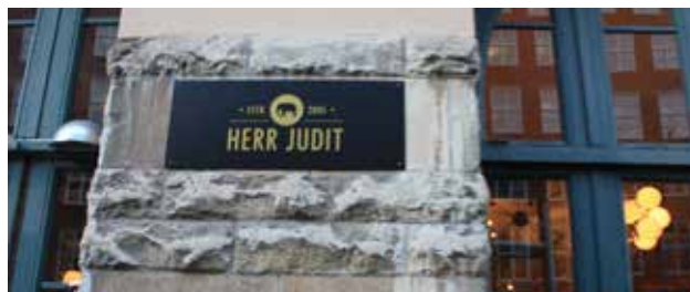
Exempel på skyltplatta vars placering har tagit hänsyn till byggnadens arkitektoniska detaljer.

Uppsättande av reklamskyltar i rondeller eller i trafik korsningar är inte tillåtet.