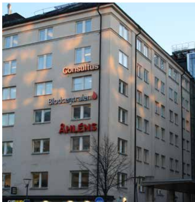
Exempel på gruppering av skyltar som tar byggnadens storlek och form i beaktning.