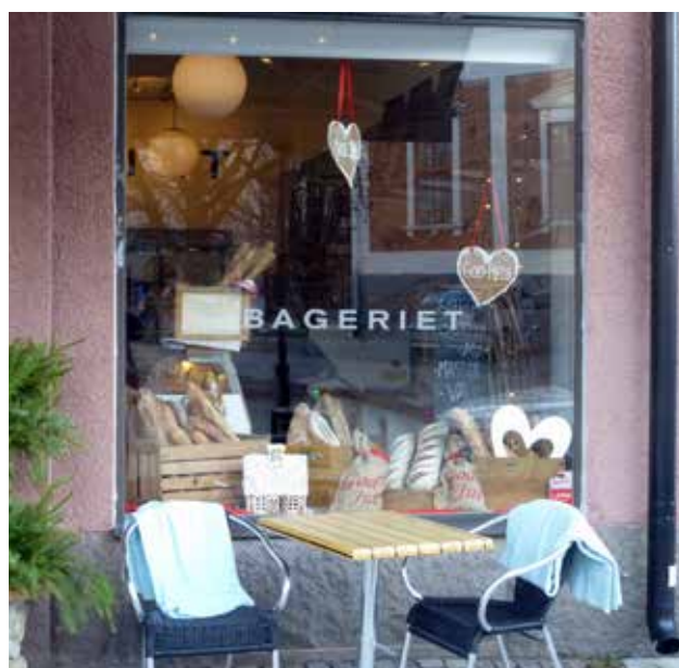
Exempel på skyltar som sammanspelar väl med byggnadernas stil, kulör och storlek.