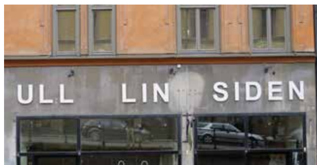
Exempel på fasadskylt med fristående bokstäver.

Vid uppsättande av skylt ska områdets historiska, kulturhistoriska, miljömässiga och konstnärliga värden skyddas. Ändringar och tillägg i bebyggelsen ska göras varsamt så att befintliga karaktärsdrag respekteras och tillvaratas.