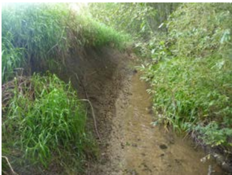
Slänt i Brobäcken