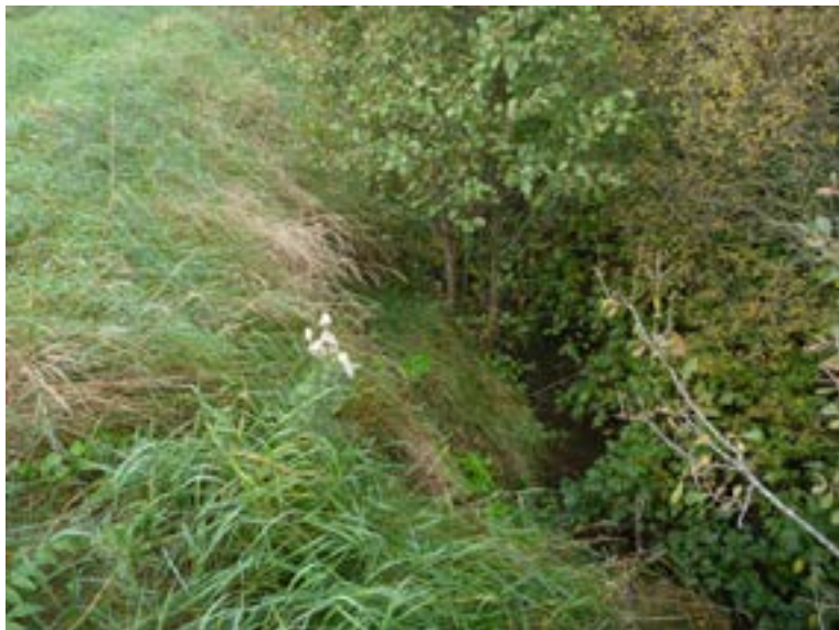
Brant stående slänt som hålls upp av tät vegetation.