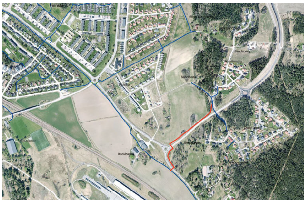
Figur 2: Samtliga blåa linjer visar kommunens primära gång- och cykelvägar som alla innehar belysningar. Den röda sträckan visar ny gång- och cykelväg som håller på att byggas i två etapper.

Samhällsbyggnadskontoret anser det vara problematiskt att anlägga någon av de platser som förslagsställaren önskat inom det önskade området.