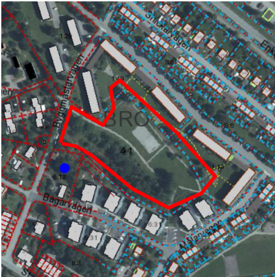
Den röda markeringen visar parkens ungefärliga utbredning

Förslagsställaren nämnde flera exempel till namn, Prästgårdsgärdet, Prostenparken och Lantmätarlunden, men namnberedningen menar att den avsedda platsen till största delen består av en gräsyta, vilket gör att ändelsen ”-ängen” lämpar sig bättre än ”-parken”, eller ändelsen ”-gårde” som associeras mer till en uppodlad yta. Förslagsställaren har tillfrågats om namnberedningens förslag och godkänt det.