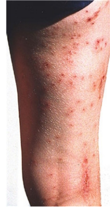
Cercarier dermatit (badklåda)

Inkubationstiden är svår att definiera på ett enkelt sätt. Symtomen förutsätter att man tidigare utsatts för cercarier och hunnit bli överkänslig. Exponeras man när man väl blivit överkänslig kommer symtomen snabbt, inom någon eller några timmar.